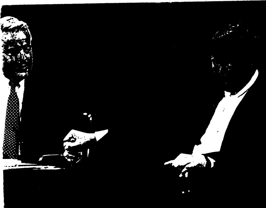
KAMPF UM FERNSEH-MINUTEN. Wahlkampf als Operette. Weil Udo Jurgens anlässlich seines 60. Geburtstages den mit ihm befreundeten Bundeskanzler ins rechte Licht setzen wollte, kommt es zum letzten Kampf zwischen ORF-General Gerd Bacher und dem Rest der Welt. Acht Tage vor der Wahl, am 1. Oktober zur besten Samstagabend-Zeit, wird Franz Vranitzky zwei Minuten lang im Gespräch mit dem Alt-Star vom Schirm lacheln. Opposition und ÖVP wollen's bis zuletzt verhindern. Was ihnen nicht gelingen durfte. Der scheidende „Tiger“ hat entschieden: Die Jurgens-Gala wird komplett ausgestrahlt. Begründung: ZDF sendet zeitgleich.